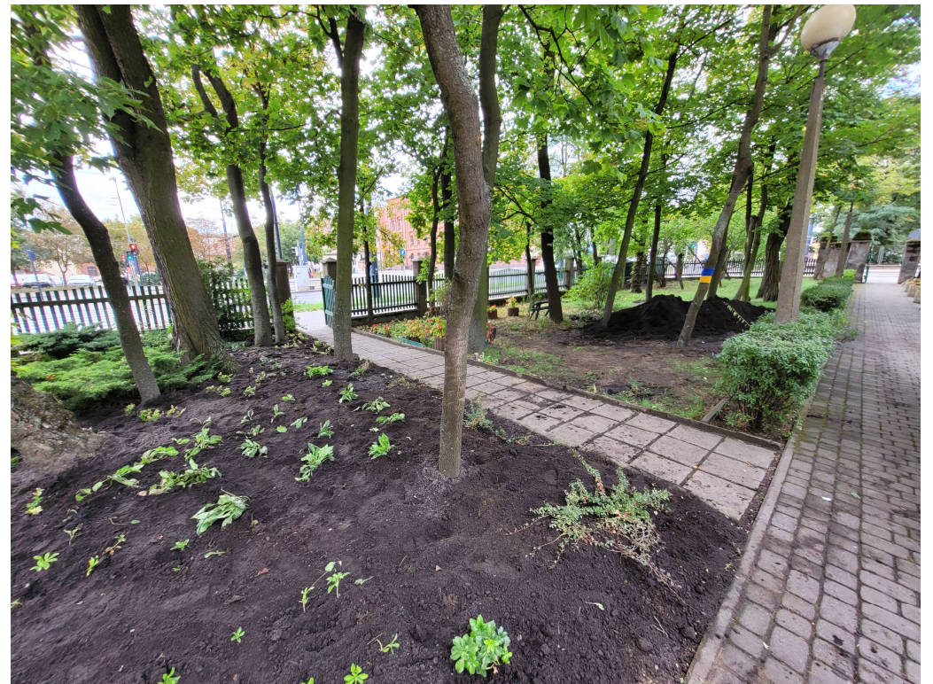
Nowe nasady zieleni przed budynkiem głównym