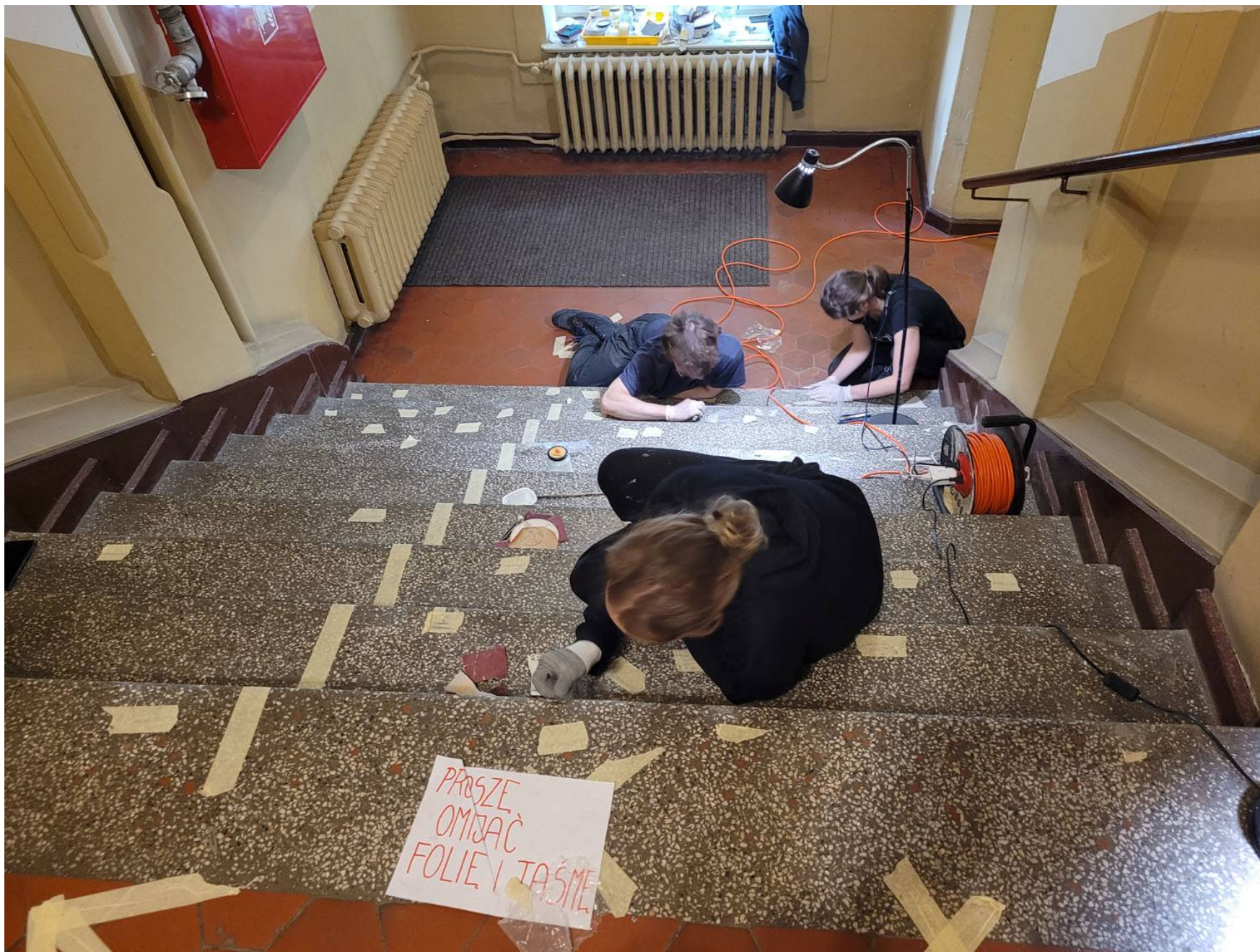
Studenci Konserwacji i Restauracji podczas prac naprawy lastriko