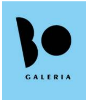
Nowa galeria Wydziału