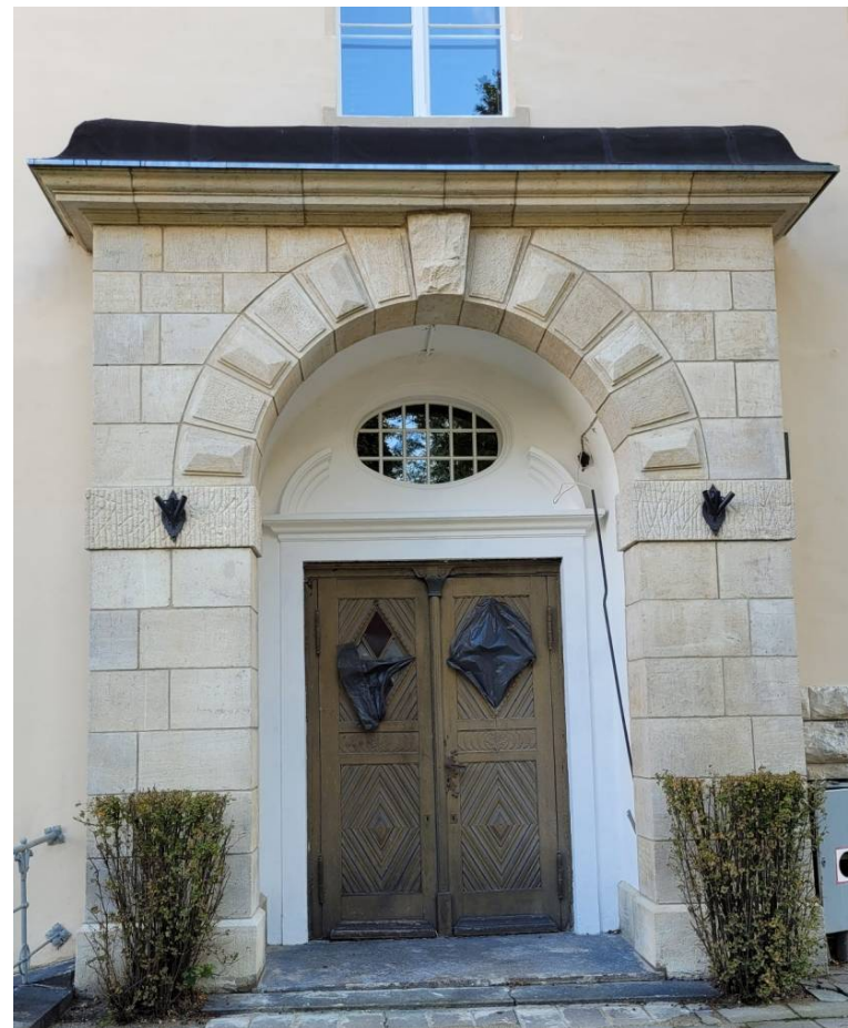
„Drugi” portal elewacji frontowej – przed, w trakcie i po konserwacji