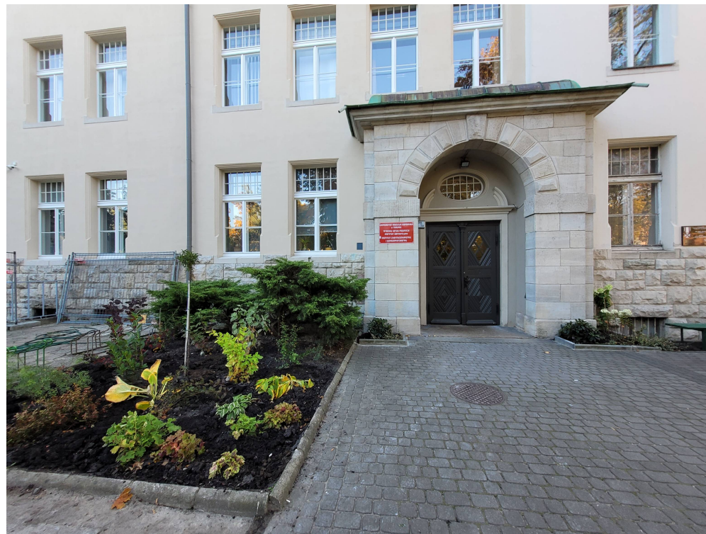
Nowe nasady zieleni przed budynkiem głównym