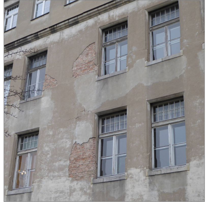
Elewacja główna Wydziału Sztuk Pięknych przed i po remoncie