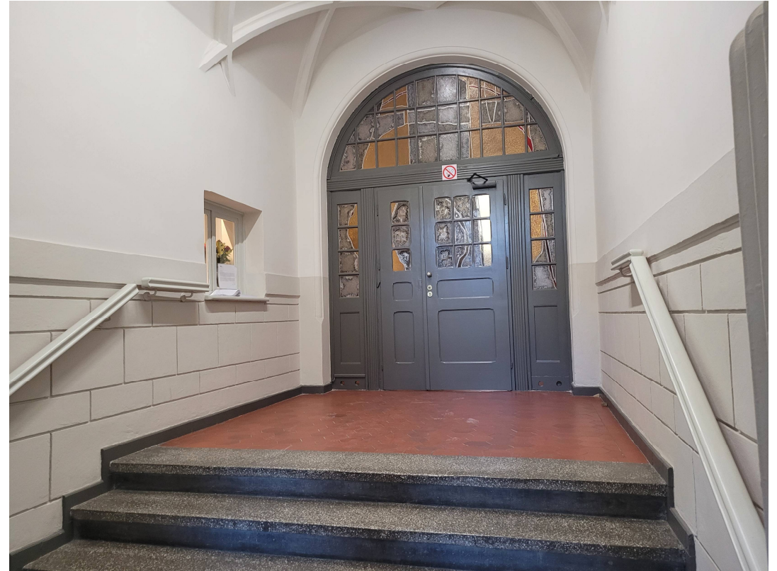
Hol główny przed i po remoncie