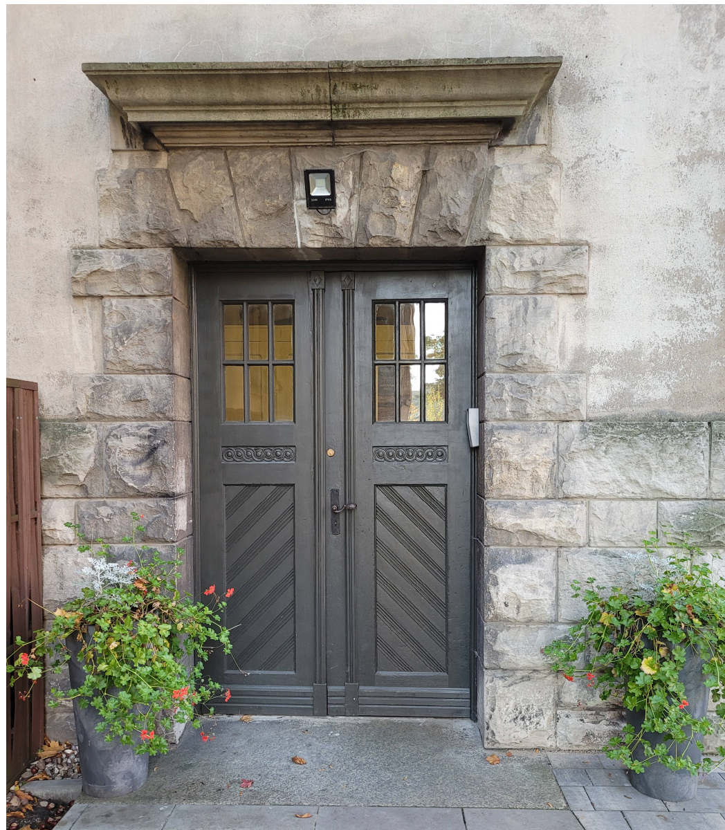
Drzwi w tylnej elewacji